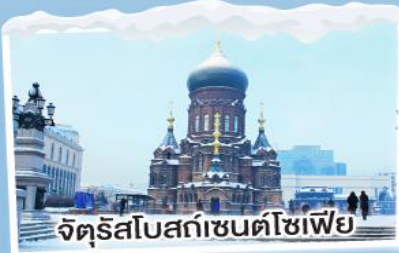
จัตุรัสโบสถ์เซนต์โฮเฟีย