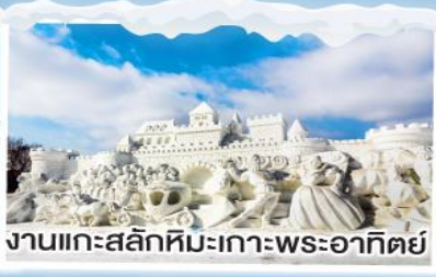
งานแกะสลักหิมะเกาะพระอาทิตย์