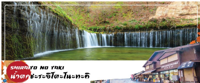
SHIRAITO NO TAKI น้ำตกชิระอิโตะโนะตะกิ

เมื่อวันที่ 22 มิถุนายน ค.ศ.2013 น้ำตกชิราอิโตะถือเป็นน้ำตกที่ศักดิ์สิทธิ์ มีศาลเจ้าอาชามะตั้งอยู่ด้วยการไหลของสายน้ำที่แยกสายออกเป็นหลากรอยเส้น ทำให้มองดูแล้วเหมือนกับสายด้ายสีขาว จึงเป็นที่มาของชื่อเรียกที่ว่า ชิราอิโตะ ที่แปลตรงตัวว่า ด้ายสีขาวนั่นเอง อีกทั้งที่นี่ยังมีเรื่องราวของการปฏิบัติธรรมในถ้ำที่เคยเกิดภูเขาไฟปะทุขึ้นมาด้วย จึงทำให้ผู้คนให้ความศรัทธากันว่าเป็นที่ชำระล้างจิตใจ และเป็นพื้นที่ศักดิ์สิทธิ์สำคัญของผู้แสวงบุญ จึงถือเป็นพาเวอร์สปอตอีกจุดหนึ่งในญี่ปุ่นที่นี้สามารถชมฟูจิซังได้ในมุมที่ไม่เหมือนใคร เป็นน้ำตกและภูเขาไฟฟูจิตั้งอยู่ด้านหลัง และถือเป็นจุดชมใบไม้เปลี่ยนสีที่สวยงามมากอีกด้วย