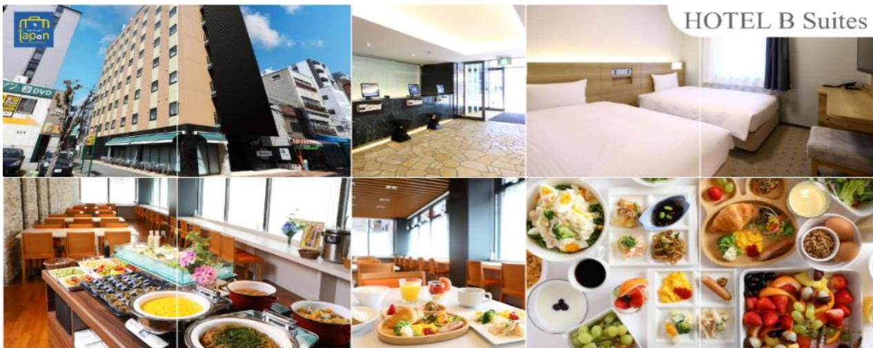
HOTEL B Suites

HOTEL B SUITES NAMBA, OSAKA หรือเทียบเท่าระดับเดียวกัน