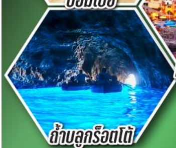
ถ้ำลูกรोटโต้