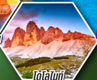
โดโลไมท์

โปรแกรมเดียว เก็บครบจบ อิตาลี ตั้งแต่เหนือถึงใต้