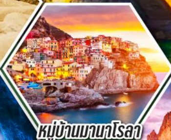
หมู่บ้านมาราโรลา