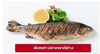
พิเศษ! ปลาเทราต์ย่าง

เกียง อาหารเกียง (มื้อที่6) เมนูพิเศษ ปลาเทราต์ย่างท่านละ 1 ตัว นำท่านเดินทางสู่ เมืองมรดกโลกเชลกี คุรมลอฟ (Cesky Krumlov) สาธารณรัฐเช็ก (ระยะทาง 210 กม./ 3.30 ชม.) ล้อมรอบด้วยแม่น้ำ Vltava ทำให้เมืองแห่งนี้มีลักษณะคล้ายหยดน้ำ จนถูกขนานนามว่าเป็น "เมืองหยดน้ำ" จากนั้นนำท่าน ถ่ายรูปบริเวณรอบนอก ปราสาทคุรมลอฟ (Cesky Krumlov Castle) เป็นปราสาทกอธิคดั้งเดิม ตั้งอยู่ริมฝั่งแม่น้ำวัลตาवानนแหลมหิน มีหอคอยสีชมพูหวานๆ ราวกับปราสาทเจ้าหญิงในนิยาย มีอายุกว่า 700 ปี เคยเป็นคฤหาสน์ส่วนตัวของขุนนางถึง 3 ตระกูล ก่อนจะตกเป็นสมบัติของรัฐบาล