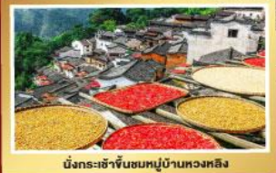
บึงกระซำขันหมอบ้านหวงหลิง