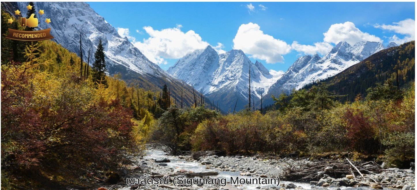
ภูเขาสีดรุณี (Siguniang Mountain)

นำท่านเดินทางประมาณ 3 ชั่วโมงสู่ ภูเขาสีดรุณี หรือชื่อเรียกเป็นภาษาจีนว่า ชื่อภูเขาเหมียงซาน (รวมรถอุทยาน) ตั้งอยู่ในอุทยานฉางผิง เขตปกครองตนเองอาปั๋ว มณฑลเสฉวน ทางตะวันตกเฉียงใต้ของจีน มีเนื้อที่กว่า 2,000 ตารางกิโลเมตร ปัจจุบันได้รับการขึ้นทะเบียนเป็นอุทยานแห่งชาติระดับ 5A และที่ได้รับความนิยมว่า เทือกเขาแอลป์ในแผ่นดินจีน เพราะมีลักษณะยิ่งใหญ่และสูงชัน คล้ายเทือกเขาแอลป์ในยุโรปตอนใต้ เป็นภูเขาที่ตั้งเรียงรายต่อกัน 4 ลูก บนที่ราบสูงจากทิศเหนือถึงทิศใต้ เป็นระยะทาง 3.5 กิโลเมตร ตั้งอยู่ระหว่างธารน้ำใสฉางผิงโกวกับไห่จื่อโกว โดยมีความสูงเหนือระดับน้ำทะเลคือ 6,250 / 5,664 / 5,454 และ 5,355 เมตร และมีหิมะปกคลุมตลอดทั้งปี เหมือนสิริระที่คลุมด้วยผ้าสีขาวของหญิงสาว 4 คน ประกอบด้วยยอดเขา 4 ลูก เรียงกันบนพื้นที่ราบสูง ประกอบด้วย ต้าภูเขาเหมียงเฟิง แปลว่า พี่สาวคนโต, เอ้อภูเขาเหมียงเฟิง แปลว่า พี่สาวคนรอง, ซานภูเขาเหมียงเฟิง แปลว่า พี่สาวคนกลาง, เหยาภูเขาเหมียงเฟิง แปลว่า น้องสาวคนสุดท้อง ตามตำนานเล่าว่าเป็นยอดเขาที่สูงที่สุดคือน้องสาวคนสุดท้องเพราะตามธรรมเนียมท้องถิ่น น้องจะมีความเป็นอยู่สบายที่สุด ร่างกายจึงเจริญเติบโตได้ดีที่สุด ส่วนพี่นั้นต้องทำงานช่วยพ่อแม่ เลี้ยงน้อง ร่างกายจึงเจริญเติบโตได้ไม่เต็มที่ ทำให้กลายเป็นภูเขาที่มีขนาดเล็กที่สุดนั่นเอง