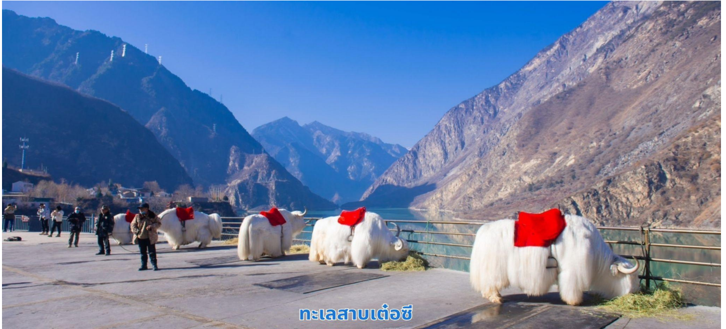
ทะเลสาบเต๋อซี

นำท่านเดินทางผ่านชม เมืองโบราณซงพาน เมืองซงพานเคยเป็นเมืองการค้าแหล่งซื้อขายแลกเปลี่ยนสินค้าตามแนวชายแดนและป้อมปราการทางภาคตะวันตกเฉียงเหนือ มีอายุเก่าแก่กว่า 500 ปี ถือเป็นเขตแดนรอยต่อและตลาดชายแดนระหว่างชาวฮั่นและชาวทิเบตในอดีต ซึ่งชาวฮั่นจะนำสินค้าจำพวกใบชา ข้าวสารและผ้าทอ ไปแลกเปลี่ยนกับสินค้าจำพวกม้า วัว หนั่งและขนสัตว์ที่มาจากทิเบต ผ่านชมซุ้มประตูและแนวกำแพงเมืองที่สร้างในสมัยราชวงศ์หมิง จากนั้นนำท่านเดินทางสู่ เมืองจิ่วจ้ายโกว เป็นพื้นที่อนุรักษ์ธรรมชาติทางตอนเหนือของมณฑลเสฉวน ตั้งอยู่ทางตอนใต้สุดของเทือกเขาหิมาลัย ห่างจากเมืองเฉิงตูไปทางเหนือ 330 กิโลเมตร เป็นสถานที่ท่องเที่ยวทางธรรมชาติมีชื่อเสียงจากน้ำตกหลายระดับชั้นและทะเลสาบที่มีสีสังคางสามารถท่องเที่ยวได้ทุกฤดูกาล ซึ่งจะได้เห็นความสวยงามของที่แห่งนี้แต่ต่างกันไปตามช่วงเวลา และได้รับการประกาศให้เป็นมรดกโลกเมื่อปี พ.ศ. 2535