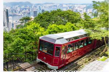
รถรางพิกแรม