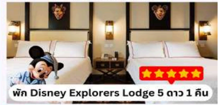
พิก Disney Explorers Lodge 5 ดาว 1 คืน