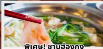
พิเศษ! ซาบูฮ่องกง