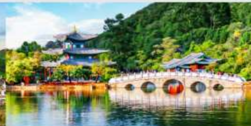
สระมัจกรดำ