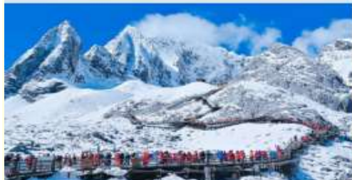
ภูเขาคิมะมัจกรหยก