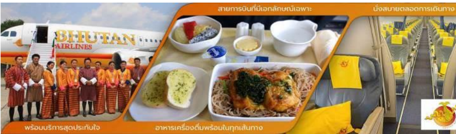
สายการบินที่มีเอกลักษณ์เฉพาะ

(เครื่องบินแวะรับส่งผู้โดยสารที่เมืองกัลกัตตา ประเทศอินเดียประมาณ 45 นาที ***ไม่ต้องลงจากเครื่อง*** )