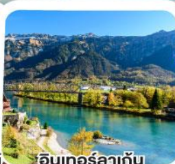
อินเทอร์ลาเก็น