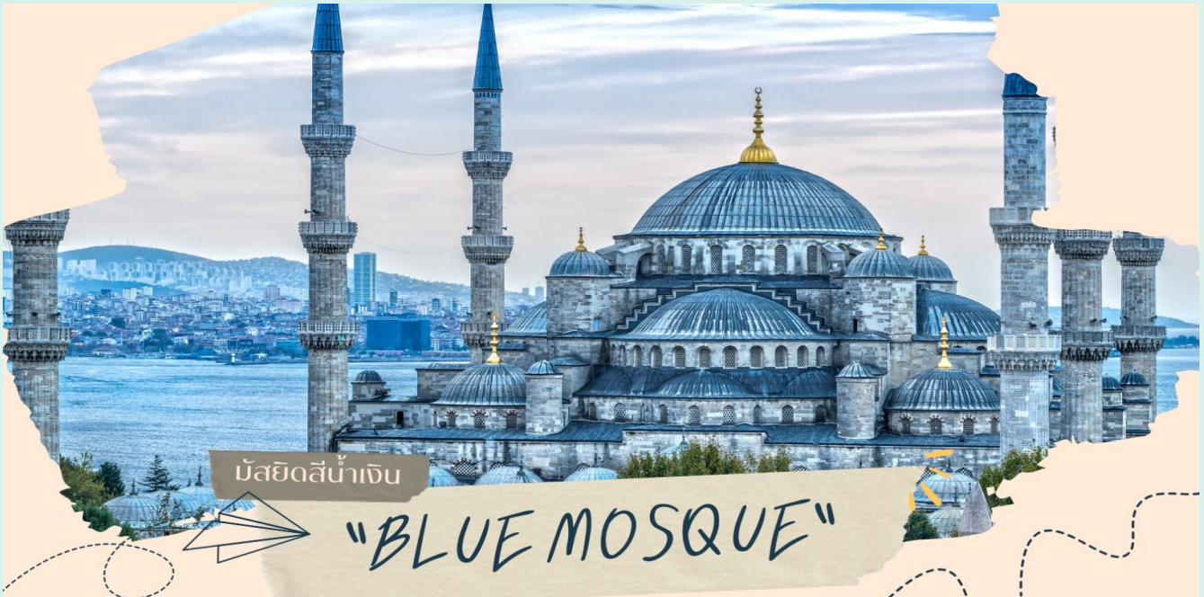
มัสยิดสีน้ำเงิน