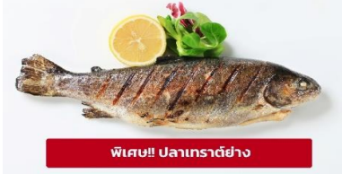
พิเศษ!! ปลาเทราต์ย่าง

เที่ยง ๑๐ รับประทานอาหารเที่ยง (มื้อที่3) เมนูพิเศษ ปลาเทราต์ย่างท่านละ 1 ตัว นำท่านเดินทางสู่ เมืองลินซ์ (Linz) (ระยะทาง 125 กม./ 2 ชม.) เป็นเมืองที่มีการผลิตเหล็ก เครื่องจักร อุปกรณ์ไฟฟ้า อดีตเป็นศูนย์กลางการค้าที่สำคัญ ให้ท่านถ่ายรูปบริเวณด้านนอก พิพิธภัณฑ์แห่งโลกอนาคต (Ars Electronica Center) ตั้งอยู่ริมแม่น้ำดานูบ เป็นที่จัดแสดงวิทยาการต่างๆ ที่ส่งผลต่อมวลมนุษยชาติปัจจุบัน ไม่ว่าจะเป็นอวกาศ หุ่นยนต์และเอไอ ยารักษาโรค เป็นต้น