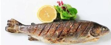
พิเศษ!! ปลาเทราต์ย่าง

เที่ยง 🍷 รับประทานอาหารเที่ยง (มื้อที่3) เมนูพิเศษ ปลาเทราต์ย่างท่านละ 1 ตัว นำท่านเดินทางสู่ เมืองลินซ์ (Linz) (ระยะทาง 125 กม./ 2 ชม.) เป็นเมืองที่มีการผลิตเหล็ก เครื่องจักร อุปกรณ์ไฟฟ้า อดีตเป็นศูนย์กลางการค้าที่สำคัญ ให้ท่านถ่ายรูปบริเวณด้านนอก พิพิธภัณฑ์แห่งโลกอนาคต (Ars Electronica Center) ตั้งอยู่ริมแม่น้ำดานูบ เป็นที่จัดแสดงวิทยาการต่างๆ ที่ส่งผลต่อมวลมนุษยย์ปัจจุบัน ไม่ว่าจะเป็นอวกาศ หุ่นยนต์และเอไอ ยารักษาโรค เป็นต้น