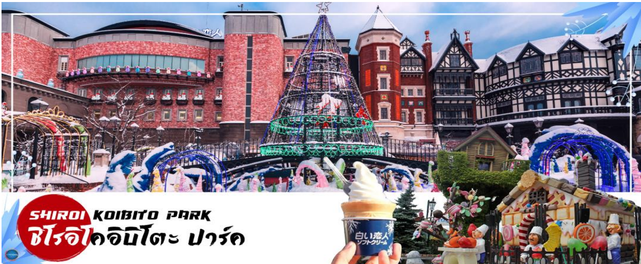
SHIROI KOIBITO PARK ชิโรอิคอบิโตะ ปาร์ค

นำท่านสู่ หมู่บ้านช็อคโกแลต อิชิยะ (Shiroi Koibito Park by Ishiya) (ด้านนอก) แหล่งผลิตช็อคโกแลตที่มีชื่อเสียงของญี่ปุ่น ตัวอาคารของ โรงงานถูกสร้างขึ้นในสไตล์ยุโรป แวดล้อมไปด้วยสวนดอกไม้ จึงทำให้บรรยากาศของหมู่บ้านช็อคโกแลตที่นี่ดูคลาสสิกและน่ารักไปอีกแบบ ช็อคโกแลตที่ขึ้นชื่อที่สุดของที่นี่คือ Shiroi Koibito ซึ่งมีความหมายว่าช็อคโกแลตขาวแต่คนรัก ท่านสามารถเลือกซื้อกลับไปให้คนที่ท่านรักทานหรือว่าซื้อเป็นของฝากติดไม้ติดมือกลับบ้านก็ได้ นอกจากนี้ท่านจะได้เลือกซื้อช็อคโกแลตที่หาซื้อที่ไหนไม่ได้ และ ท่านก็ยังจะได้ชมประวัติความเป็นมาของโรงงาน และการผลิตช็อคโกแลตอีกด้วย