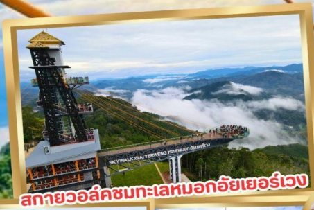
สกายวอล์คชมทะเลหมอกอัยเยอร์เวง

ร่วมโครงการ ลดหย่อนภาษี ลดสูงสุด 15,000.-