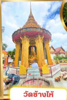
วัดช้างไห้