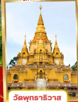
วัดพุทธาธิวาส