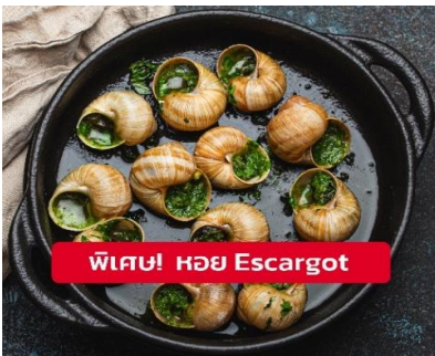
พิเศษ! หอย Escargot

เที่ยง ๑๐ รับประทานอาหารเที่ยง (มื้อที่11) เมนูพิเศษ!! หอย Escargot