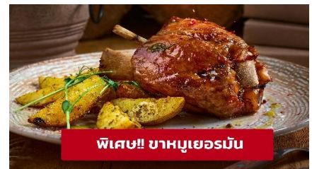
พิเศษ!! ขาหมูเยอรมัน

เที่ยง 🍴 รับประทานอาหารกลางวัน (มือที่3) เมนูพิเศษ! ขาหมูเยอรมัน จากนั้นนำท่านเที่ยวชม เมืองซุก (ZUG) ประเทศสวิตเซอร์แลนด์ (ระยะทาง 259 กม. / 3.45 ชม.) เป็นเมืองที่ร่ำรวยที่สุดในประเทศ และซุกเป็นเมืองที่ติดอันดับหนึ่งในสิบของโลกเมืองที่สะอาดที่สุด อิสระ-ช้อปปิ้งที่ Lohri AG Store ที่มีนาฬิกาชั้นนำระดับโลกให้ท่านเลือกซื้อเลือกชม อาทิเช่น Patek Philippe, Franck Muller Cartier, Omega, Tag Heuer ฯลฯ