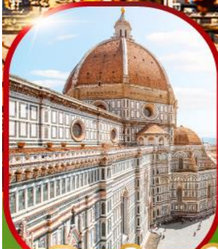
มหาวิหารฟลอเรนซ์