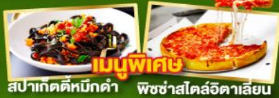
เมนูพิเศษ สปาเก็ตตีหมึกดำ พิชซ่าสโตร์อิตาลีเย็น