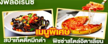
เมนูพิเศษ สปาคัดดีหมึกดำ พืชซ่าสโตร์อิตาลีเลียน