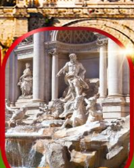
น้ำพุเทรวี่

เดินทาง 26 ธ.ค.67 - 02 ม.ค. 68(ปีใหม่) 28 ธ.ค.67 - 04 ม.ค. 68(ปีใหม่)