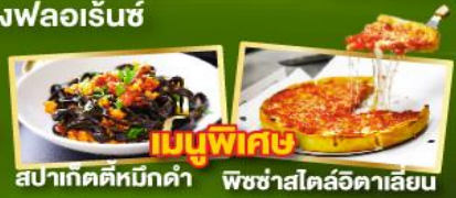
เมนูพิเศษ สปาเกตตีหอกัดดา พืชซ่าสโด้ลัดดาเลียน