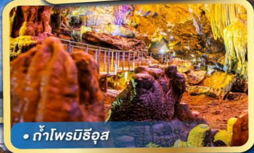
• ถ้ำไพรมีริอุส