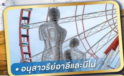
• อนุสาวรีย์อาลีและนีโน