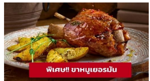
พิเศษ!! ขาหมูเยอรมัน

นำท่านเดินทางสู่ เมืองมิวนิก (Munich) (ระยะทาง 127 กม./ 2.30 ชม.) เป็นหนึ่งในเมืองมั่งคั่งที่สุดของยุโรป มีพรมแดนติดเทือกเขาแอลป์ พาทุกท่านไปเช็คอินสถานที่ชื่อดังที่มีความสำคัญของเมืองมิวนิก จากนั้นนำท่านสู่บริเวณ มาเรียนพลาทซ์ (Marienplatz) จตุรัสกลางใจเมืองในเขตเมืองเก่า ปัจจุบันที่เป็นเหมือนพื้นที่สำหรับงานพิธีต่างๆ ที่สำคัญของเมือง ถัดมาเป็น