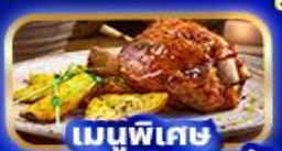
เมนูพิเศษ ขาคูเยอรมัน

บริการนำดื่มวันละ 1 ขวด ฟรี! ปลั๊กไฟยูนิเวอร์แซล