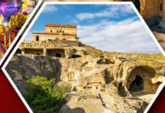
เมืองถ้ำอพลิสตีเคห์