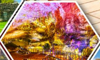
ถ้ำไฟรมิรุอส