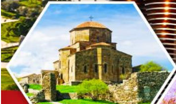
วิหารจวารี