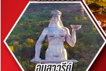
อนุสาวรีย์