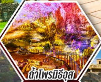
ด้าไฟรมีริอุส