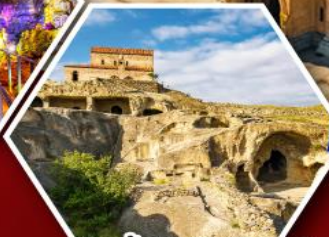
เมืองด้าอพลิสตีเคห์