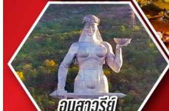
อนุสาวรีย์