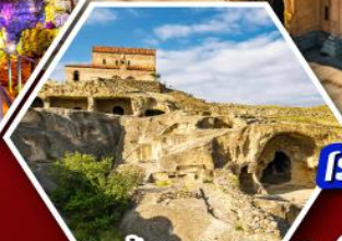
เมืองดำอิพลิสตีเคห์

แพ็คเกจ Rooms Hotel โรงแรมวิวทิวทัศน์ของเทือกเขาคอเคซัส