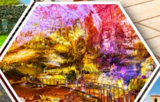
ลำไพลีริอุส