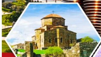
วิหารจวารี