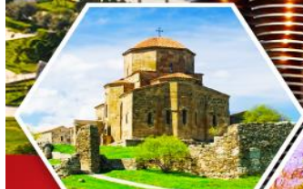
วิหารจวารี