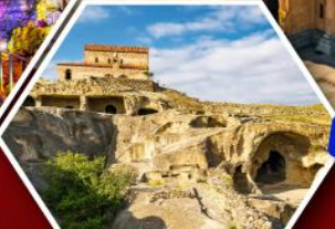
เมืองด้าอิพลิสตีเชค

แพ็คเกจ Rooms Hotel โรงแรมวิวหลักล้านของเทือกเขาคอเคซัส