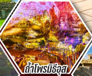
ด้าไฟรมิธิอุส