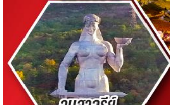
อนสาวรีย์