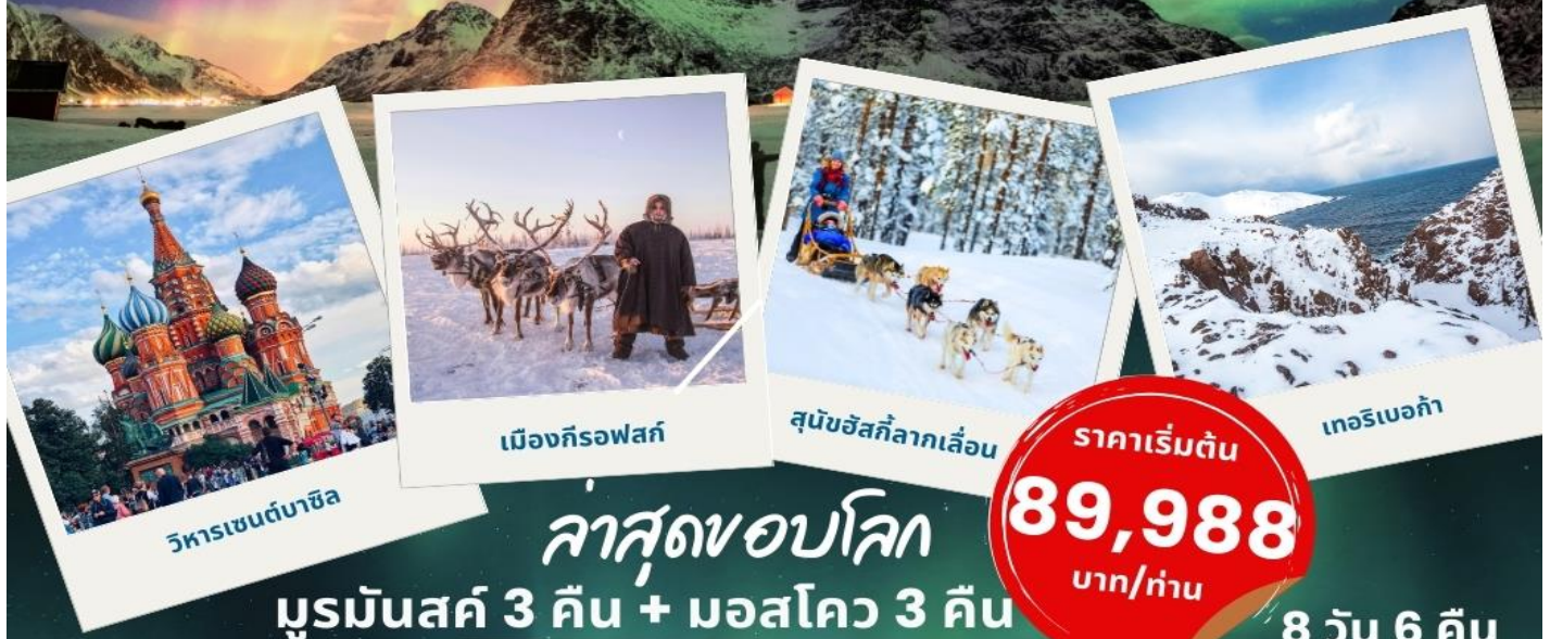
วิหารเซนต์บาซิล