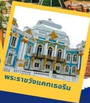
พระราชวังแคเรอีน