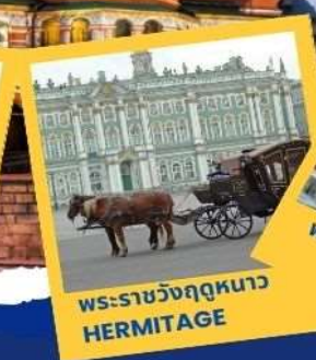
พระราชวังฤดูหนาว HERMITAGE