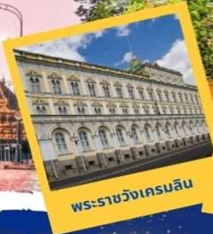
พระราชวังเครมลิน

เที่ยว 3 พระราชวัง รวมค่าเข้าชมทุกสถานที่!!