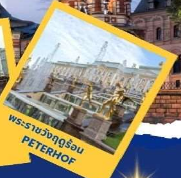
พระราชวังฤดูร้อน PETERHOF