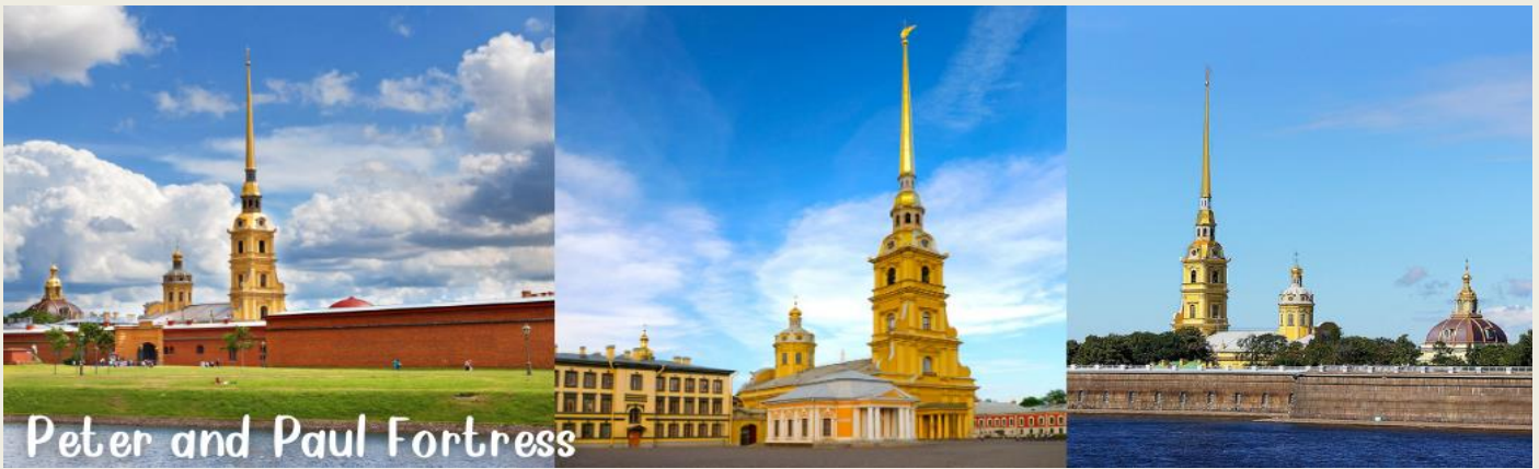
Peter and Paul Fortress

นำท่านชม ป้อมปีเตอร์ แอนด์ ปอลด์ (Peter And Paul) เป็นสิ่งก่อสร้างแรกสุดของเมือง St Petersburg สร้างในปีค.ศ 1703 เป็นอนุสรณ์ชัยชนะสงครามเหนือสวีเดน ด้วยศิลปะแบบบารอกเพื่อใช้เป็นป้อมปราการในการป้องกันข้าศึกกรุกราน ตั้งอยู่บน เกาะวาซิลเยฟสกี (Vasilievsky Island) ลักษณะเป็นรูปทรงหกเหลี่ยม กำแพงเป็นหินก่ออิฐ ส่วนวิหารปีเตอร์ แอนด์ ปอลด์ (Peter-and-Paul-Fortress) เริ่มสร้างขึ้นเมื่อปีค.ศ 1712 ด้วยการ ออกแบบของ DomennicaTrezini สร้างเสร็จในวันที่ 29 มิถุนายน ค.ศ 1733 ตั้งชื่อวิหารแห่งนี้เพื่อเป็นเกียรติแด่นักบุญปีเตอร์ และนักบุญปอลด์เพื่อเป็นการเผยแพร่ศาสนา ความสูงของยอดแหลมคือ 122.5 เมตร ในอดีตเป็นสิ่ง ก่อสร้างที่สูงที่สุดของเมืองและห้ามสร้างสิ่งก่อสร้างใดสูงกว่า ภายในทำการตกแต่งด้วยศิลปะบารอกซึ่งนับว่าแตกต่าง กับโบสถ์คริสต์ออร์ทอดอกซ์ทั่วไปและวิหารแห่งนี้ยังเป็นที่เก็บพระศพของราชวงศ์โรมานอฟ เริ่มต้นจากพระเจ้าปีเตอร์มหาราชเป็นองค์แรก จนกระทั่งถึงกษัตริย์องค์สุดท้ายของราชวงศ์