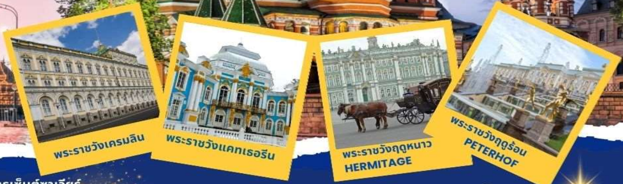
พระราชวังเครมลิน

เที่ยว 3 พระราชวัง รวมค่าเข้าชมทุกสถานที่!!