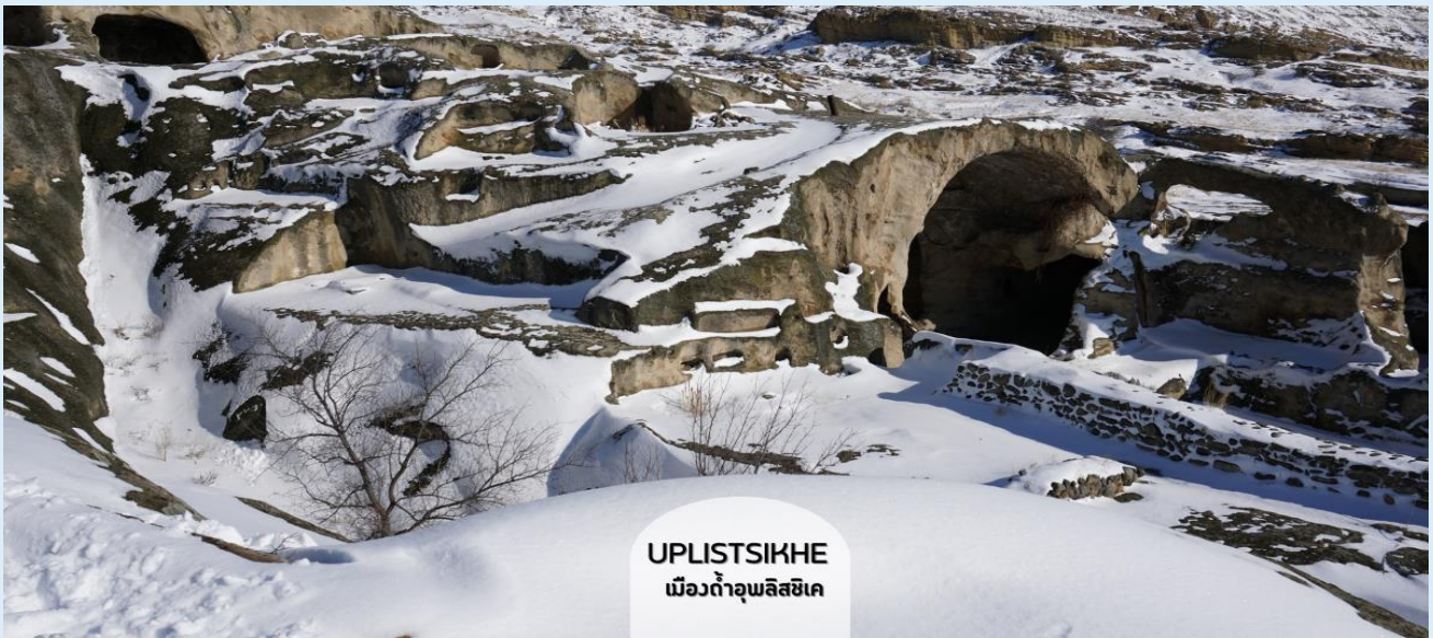
UPLISTSIKHE เมืองถ้ำอูปลิสซิกเค

ชมเมืองถ้ำโบราณอูปลิสซิกเค (Uplistsikhe) ตามภาษาจอร์เจีย แปลว่า “ป้อมปราการของขุนนาง” สัญลักษณ์ของความโบราณและความเป็นเอกลักษณ์ของจอร์เจีย อายุกว่า 3,000 ปีแล้ว เมืองนี้ใช้การสร้างโดยเจาะภูเขาหินจนลึกเข้าไปเป็นถ้ำ และมีการอยู่อาศัยกันจนเป็นชุมชนใหญ่ มีทั้งที่พักอาศัย ร้านค้า โบสถ์ คูหา ฯลฯ รอบๆ เมืองยังมีวิวเทือกเขา และแม่น้ำมิควารีที่สวยงามด้วยเมืองถ้ำ ทั้งหมดถูกสร้างขึ้นตั้งแต่สมัยต้นยุคเหล็ก จนถึงปลายยุคกลาง ที่ให้กลิ่นอายผสมผสานระหว่างวัฒนธรรมของดินแดนอนาโตเลียของตุรเคีย ผสมผสานกับดินแดนเปอร์เซียของอิหร่าน โดยนักโบราณคดีได้สันนิษฐานว่าที่นี่ถือเป็นแหล่งที่อยู่อาศัยที่เก่าแก่ที่สุดในประเทศ ปัจจุบันได้รับการขึ้นทะเบียนให้เป็นมรดกโลกโดยองค์การยูเนสโก