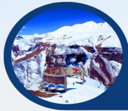
จุดถ่ายรูป Panorama Gudauri