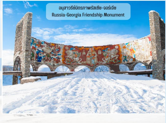
อนุสาวรีย์มิตรภาพรัสเซีย-จอร์เจีย Russia-Georgia Friendship Monument