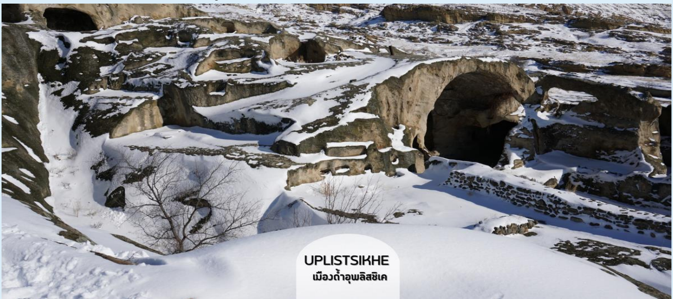
UPLISTSIKHE เมืองถ้ำอุปลิสซิกเค

ชมเมืองถ้ำโบราณอุปลิสซิกเค (Uplistsikhe) ตามภาษาจอร์เจีย แปลว่า “ป้อมปราการของขุนนาง” สัญลักษณ์ของความโบราณและความเป็นเอกลักษณ์ของจอร์เจีย อายุกว่า 3,000 ปีแล้ว เมืองนี้ใช้การสร้างโดยเจาะภูเขาหินจนลึกเข้าไปเป็นถ้ำ และมีการอยู่อาศัยกันจนเป็นชุมชนใหญ่ มีทั้งที่พักอาศัย ร้านค้า โบสถ์ คูหา ฯลฯ รอบๆ เมืองยังมีวิวเทือกเขา และแม่น้ำมิควารีที่สวยงามด้วยเมืองถ้ำ ทั้งหมดถูกสร้างขึ้นตั้งแต่สมัยต้นยุคเหล็ก จนถึงปลายยุคกลาง ที่ให้กลิ่นอายผสมผสานระหว่างวัฒนธรรมของดินแดนอนาโตเลียของตุรเคีย ผสมผสานกับดินแดนเปอร์เซียของอิหร่าน โดยนักโบราณคดีได้สันนิษฐานว่าที่นี่ถือเป็นแหล่งที่อยู่อาศัยที่เก่าแก่ที่สุดในประเทศ ปัจจุบันได้รับการขึ้นทะเบียนให้เป็นมรดกโลกโดยองค์การยูเนสโก