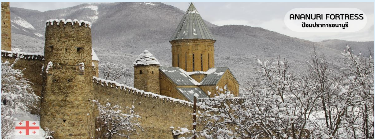
ANANURI FORTRESS ป้อมปราการอนานูรี

แฉะชมป้อมปราการอนานูรี (Ananuri Fortress) ป้อมปราการที่มีความเก่าแก่ของประเทศจอร์เจีย สร้างขึ้นในศตวรรษที่ 16-17 ตั้งอยู่ริมแม่น้ำ Aragvi หนึ่งในแม่น้ำสายสำคัญของประเทศจอร์เจียจากมุมสูง มีทิวทัศน์ความสวยงามของอ่างเก็บน้ำชินวาลี (Zhinvali Reservoir) และยังมีเขื่อนซึ่งเป็นสถานที่ที่สำคัญสำหรับนำน้ำที่เก็บไว้ส่งต่อไปยังเมืองหลวง พร้อมใช้ผลิตกระแสไฟฟ้า ที่ทำให้ชาวเมืองทบิลีซีมีน้ำใช้ดื่มใช้ ร่องรอยของซากกำแพงที่ล้อมรอบป้อมปราการแห่งนี้เปรียบเสมือนม่านที่ซ่อนเร้นความงามของโบสถ์ 2 หลัง ที่เป็นโบสถ์เก่าแก่ 2 หลัง คือโบสถ์เก่าแก่แห่งพระนางแมรี่ผู้บริสุทธิ์ (The older Church of the Virgin) ส่วนอีกโบสถ์คือโบสถ์ยิ่งใหญ่แห่งอัสสัมชัญ