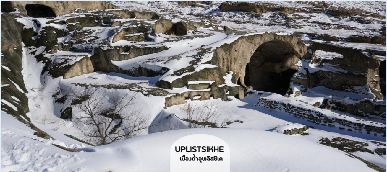
UPLISTSIKHE เมืองถ้ำอุปลิสซิกเค

ชมเมืองถ้ำโบราณอุปลิสซิกเค (Uplistsikhe) ตามภาษาจอร์เจีย แปลว่า “ป้อมปราการของขุนนาง” สัญลักษณ์ของความโบราณและความเป็นเอกลักษณ์ของจอร์เจีย อายุกว่า 3,000 ปีแล้ว เมืองนี้ใช้การสร้างโดยเจาะภูเขาหินจนลึกเข้าไปเป็นถ้ำ และมีการอยู่อาศัยกันจนเป็นชุมชนใหญ่ มีทั้งที่พักอาศัย ร้านค้า โบสถ์ คูหา ฯลฯ รอบๆ เมืองยังมีวิวเทือกเขา และแม่น้ำมิควารีที่สวยงามด้วยเมืองถ้ำ ทั้งหมดถูกสร้างขึ้นตั้งแต่สมัยต้นยุคเหล็ก จนถึงปลายยุคกลาง ที่ให้กลิ่นอายผสมผสานระหว่างวัฒนธรรมของดินแดนอนาโตเลียของตุรเคีย ผสมผสานกับดินแดนเปอร์เซียของอิหร่าน โดยนักโบราณคดีได้สันนิษฐานว่าที่นี่ถือเป็นแหล่งที่อยู่อาศัยที่เก่าแก่ที่สุดในประเทศ ปัจจุบันได้รับการขึ้นทะเบียนให้เป็นมรดกโลกโดยองค์การยูเนสโก