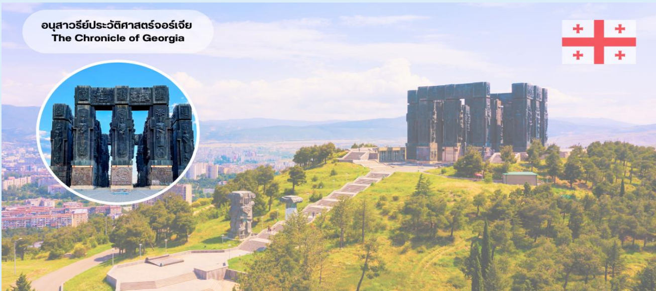
อนุสาวรีย์ประวัติศาสตร์จอร์เจีย The Chronicle of Georgia

ชมความอลังการเสายักษ์ และย้อนรอยประวัติศาสตร์จอร์เจีย “อนุสรณ์ประวัติศาสตร์จอร์เจีย” ได้ชื่อว่าเป็น “ Stonehenge of Georgia “