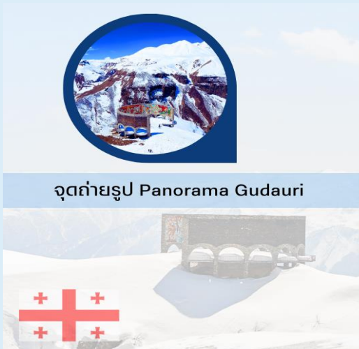
จุดถ่ายรูป Panorama Gudauri