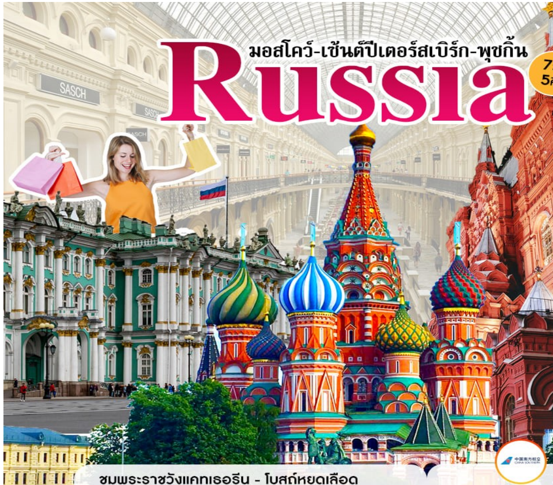
ชมพระราชวังแคทเธอริน - โบสถ์หยดเลือด