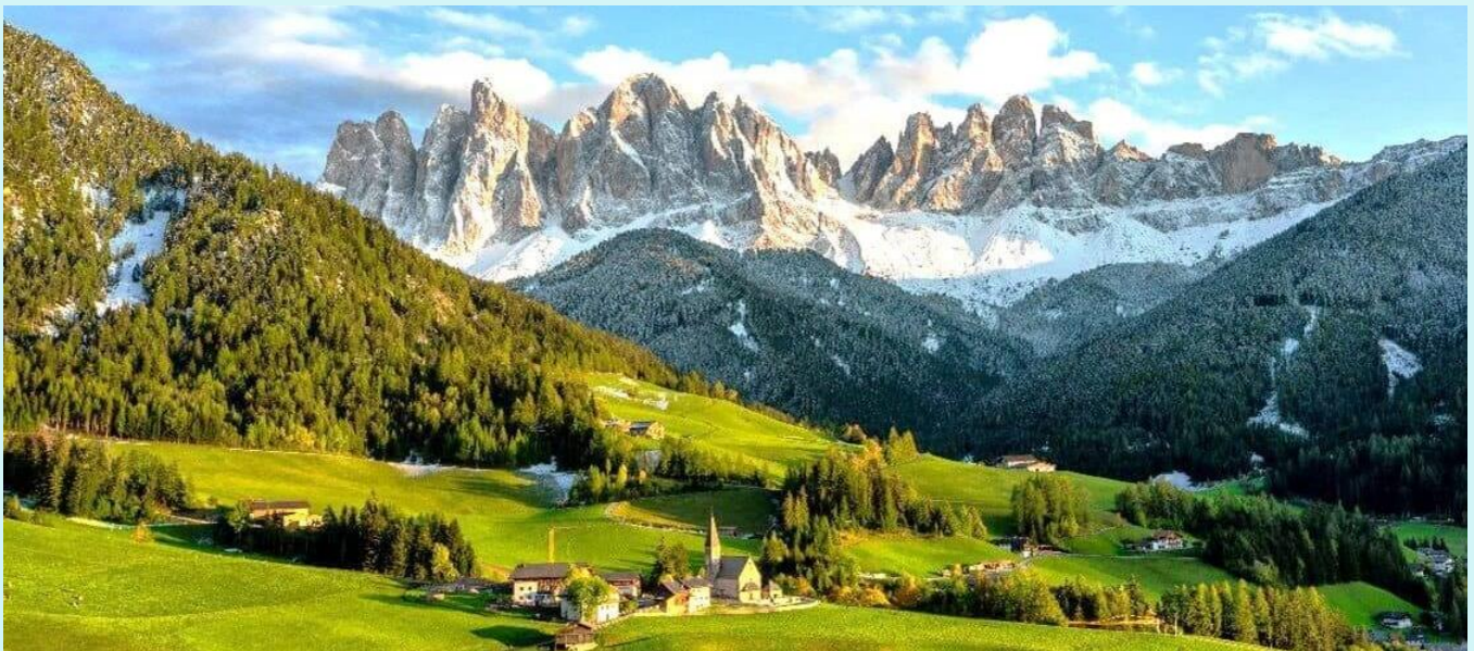
VFCOMXP85SV-11 อิตาลี ที่เด็ด ของแถม Dolomites 8D5N BY SV

จากนั้นนำท่านเก็บภาพความประทับใจกับวิวไฮไลท์ ของเทือกเขา Dolomites ณ Santa Maddalena (ใช้เวลาเดินทางประมาณ 30 นาที) ถ่ายรูปกับหนึ่งจุดไฮไลต์ด้วยวิวยอดเขาแปลกตาอีกแห่งหนึ่งในโดโลไมท์ ณ โบสถ์ Santa Maddalena โบสถ์ที่ถือเป็นสถานที่ไฮไลต์ที่ถูกถ่ายรูปมากที่สุด ในอุทยานโดโลไมท์ มีวิวทิวทัศน์ที่สวยงามมีฉากหลังเป็นเทือกเขา Odles