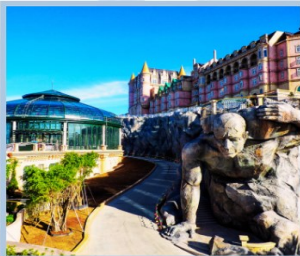
โถง Eclipse Square