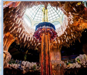
สวนสนุก Fantasy Park

เย็น บริการอาหารเย็น (บุปเฟ่ต์นานาชาติ บนบานานาฮิลล์)