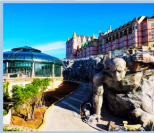
โซน Eclipse Square