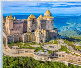
ปราสาทจันทร