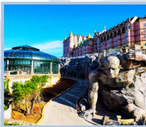
โซล Eclipse Square