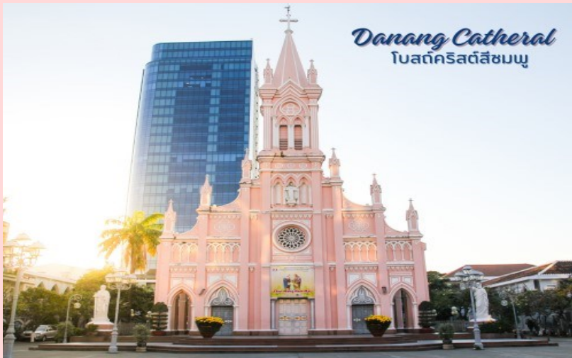
Danang Cathedral โบสถ์คริสต์สีชมพู

นำท่านถ่ายรูป โบสถ์คริสต์ดานัง หรือโบสถ์คริสต์สีชมพู (Danang Cathedral) สร้างขึ้นสมัยเวียดนาม ตกเป็นอาณานิคมของฝรั่งเศส สถาปัตยกรรมสไตล์โกธิก ยตกแต่งด้วยความประณีตสวยงาม ตัวโบสถ์เป็นสีชมพูทั้งหลัง ตัดขอบด้วยสีขาว เป็นอีกหนึ่งสถานที่ที่ไม่ควรต้องพลาดเมื่อมาเยือนเมืองดานัง จากนั้น อิสระช้อปปิ้ง ตลาดฮาน อิสระเลือกซื้อสินค้าหลากหลายชนิด เช่นผ้า เหล้า บุหรี่ และของกินต่างๆ เป็นตลาดสดและขายสินค้าพื้นเมืองของเมืองดานัง