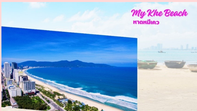
My Khe Beach หาดหมีเคว

พาชมหาดหมีเคว (My Khe Beach) ชายหาดที่สวยงามที่สุดในเมืองดานัง มีแนวโค้งตามลักษณะภูมิประเทศของเวียดนามซึ่งยาวกว่า 32 กิโลเมตร มีหาดทรายสีขาวและเม็ดทรายละเอียด น้ำทะเลสีฟ้าใส ท่านจะได้เพลิดเพลินไปกับธรรมชาติที่สวยงามทั้งวิวภูเขาและอ่าวที่อยู่ตรงข้าม อิสระถ่ายรูปเช็คอินตามอัธยาศัย