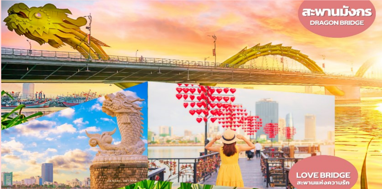
สะพานมังกร DRAGON BRIDGE