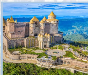
ปราสาทจันตรา