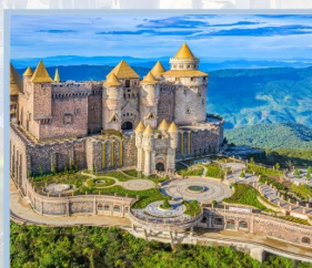
ปราสาทจันตรา