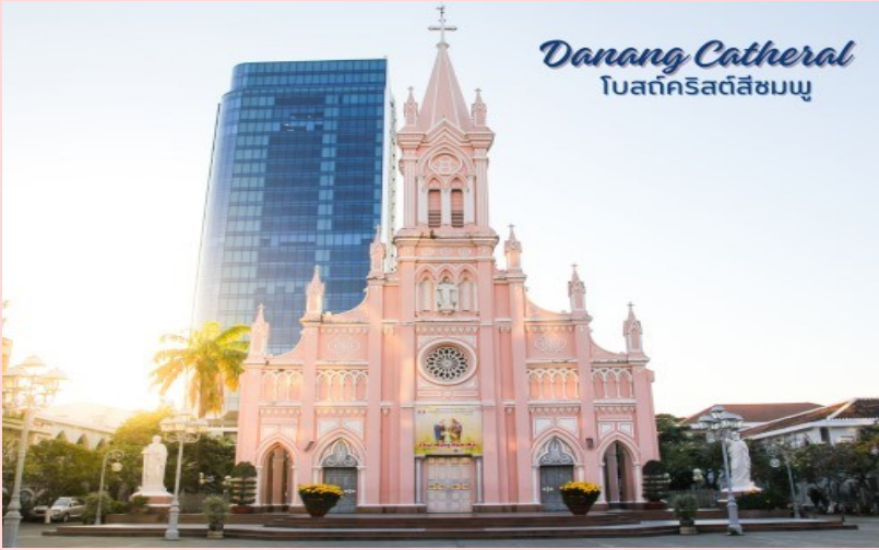
Danang Cathedral โบสถ์คริสต์สีชมพู

นำท่านถ่ายรูป โบสถ์คริสต์ดานัง หรือโบสถ์คริสต์สีชมพู (Danang Cathedral) สร้างขึ้นสมัยเวียดนาม ตกเป็นอาณานิคมของฝรั่งเศส สถาปัตยกรรมสไตล์โกธิก ตกแต่งด้วยความประณีตสวยงาม ตัวโบสถ์เป็นสีชมพูทั้งหลัง ตัดขอบด้วยสีขาว เป็นอีกหนึ่งสถานที่ที่ไม่ควรต้องพลาดเมื่อมาเยือนเมืองดานัง จากนั้น อิสระช้อปปิ้ง ตลาดฮาน อิสระเลือกซื้อสินค้าหลากหลายชนิด เช่นผ้า เหล้า บุหรี่ และของกินต่างๆ เป็นตลาดสดและขายสินค้าพื้นเมืองของเมืองดานัง