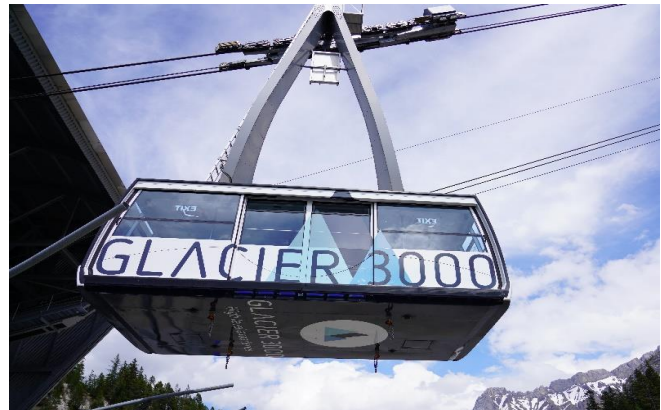
Highlight ! กระเช้าไฟฟ้าขนาดยักษ์ที่จุผู้โดยสารได้ถึง 125 คน

นำท่านเดินทางสู่ หมู่บ้านโคล เดอ ปียง (Col De Pillon) เป็นที่ตั้งของสถานี นำท่านนั่งกระเช้าลอยฟ้า สู่ ยอดเขากลาเซียร์ 3000 (Glacier 3000) มีความสูงเกือบ 3,000 เมตรเหนือระดับน้ำทะเล ชมทิวทัศน์อันงดงามของท้องฟ้าและเทือกเขามากมายแบบพาโนรามา และให้ท่านท้าทายความสูงเดินบน "The Peak Walk by Tissot" สะพานแขวนที่มีความยาว 107 เมตรข้ามหน้าผาที่ระดับความสูง 3,000 เมตร ทำให้เป็นสะพานแขวนที่สูงที่สุดในโลก