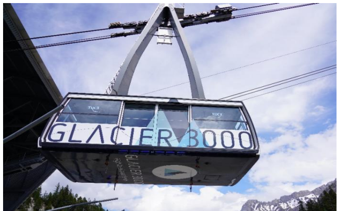
Highlight ! กระเช้าไฟฟ้าขนาดยักษ์ที่จุผู้โดยสารได้ถึง 125 คน

นำท่านเดินทางสู่ หมู่บ้านโคล เดอ ปียง (Col De Pillon) เป็นที่ตั้งของสถานี นำท่านนั่งกระเช้าลอยฟ้า สู่ ยอดเขากลาเซียร์ 3000 (Glacier 3000) มีความสูงเกือบ 3,000 เมตรเหนือระดับน้ำทะเล ชมทิวทัศน์อันงดงามของท้องฟ้าและเทือกเขามากมายแบบพาโนรามา และให้ท่านท้าทายความสูงเดินบน "The Peak Walk by Tissot" สะพานแขวนที่มีความยาว 107 เมตรข้ามหน้าผาที่ระดับความสูง 3,000 เมตร ทำให้เป็นสะพานแขวนที่สูงที่สุดในโลก