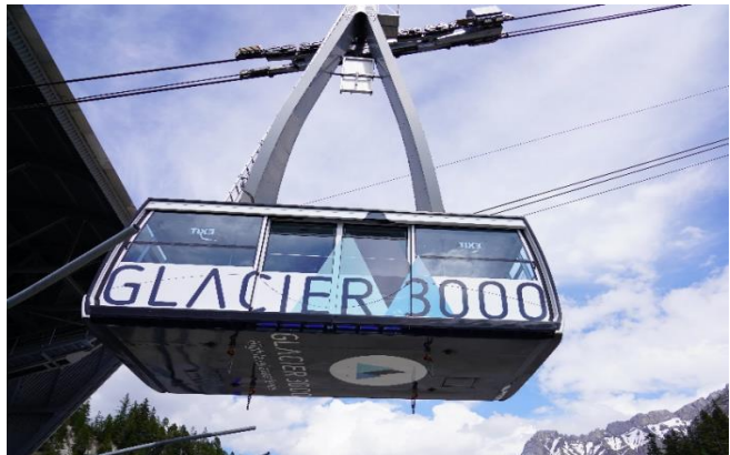
Highlight ! กระเช้าไฟฟ้าขนาดยักษ์ที่จุผู้โดยสารได้ถึง 125 คน

นำท่านเดินทางสู่ หมู่บ้านโคล เดอ ปียง (Col De Pillon) เป็นที่ตั้งของสถานี นำท่านนั่งกระเช้าลอยฟ้า สู่ ยอดเขากลาเซียร์ 3000 (Glacier 3000) มีความสูงเกือบ 3,000 เมตรเหนือระดับน้ำทะเล ชมทิวทัศน์อันงดงามของท้องฟ้าและเทือกเขามากมายแบบพาโนรามา และให้ท่านท้าทายความสูงเดินบน "The Peak Walk by Tissot" สะพานแขวนที่มีความยาว 107 เมตรข้ามหน้าผาที่ระดับความสูง 3,000 เมตร ทำให้เป็นสะพานแขวนที่สูงที่สุดในโลก