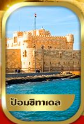
ปิอมอิทาเด