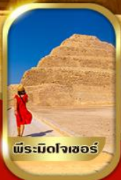
พีระมิดจอร์