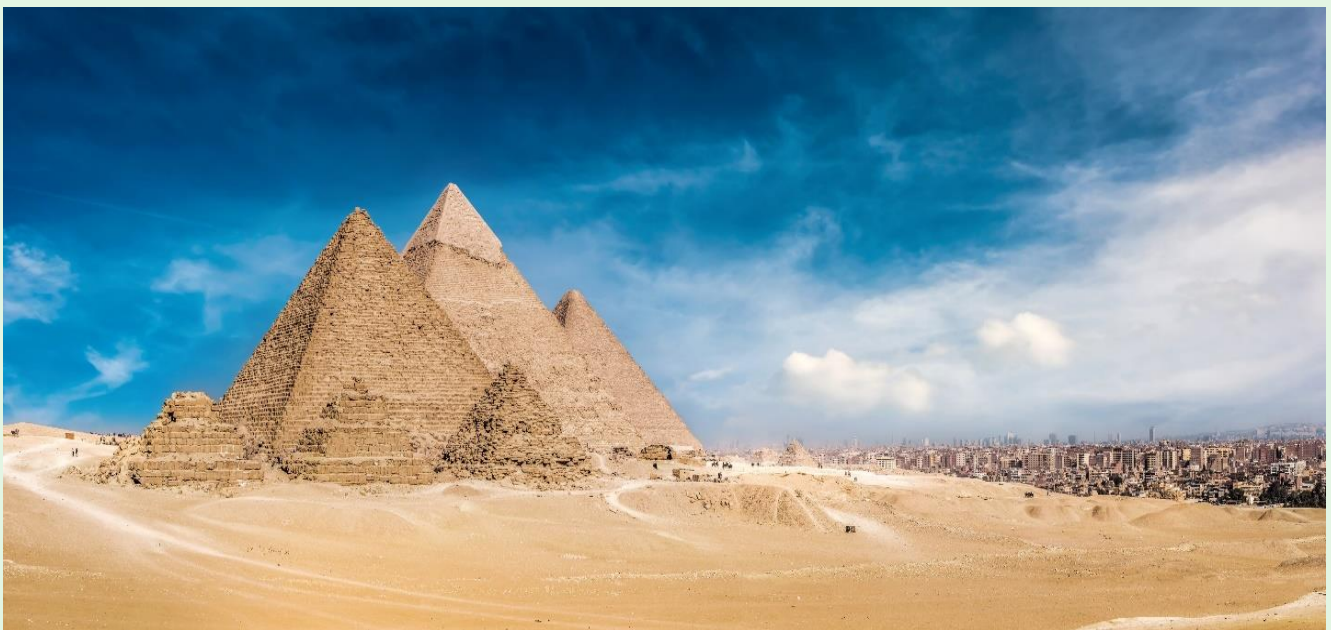
VEG64G9-1 Egypt อียิปต์ไครไม่หีบ กดLikeหีบแน้ 6D4N (Sep - Dec 24) By G9

* อิสระให้ท่านเที่ยวชม พีระมิดกิซ่า ตามอัธยาศัย (ไม่รวมค่าเข้าชมภายในตัวพีระมิด) ค่าใช้จ่ายในการเข้าชมพีระมิดเมนคูเร ประมาณท่านละ 10 USD ทั้งนี้ในแต่ละวัน การเข้าชมพีระมิดจะจำกัดผู้เข้าชมได้ไม่เกินวันละ 300 คนเท่านั้น กรณีสนใจเข้าชมกรุณาติดต่อหัวหน้าทัวร์ล่วงหน้า