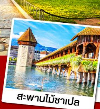
สวิสบ้านไม้ชาเปล

11-19 ก.พ. 68 08-16, 15-23 มี.ค. 68 09-17 เม.ย. 68