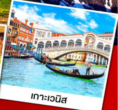
เกาะเวนิส