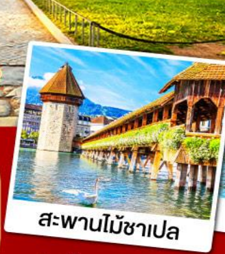
สะพานไม้ชาเปล

30 พ.ย.-08 ธ.ค., 08-16 ธ.ค.67 28 ธ.ค.-05 ม.ค., 11-19 ก.พ.68 08-16, 15-23 มี.ค.68 09-17 เม.ย.68