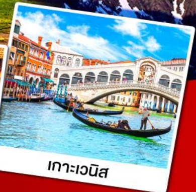
เกาะเวนิส