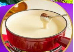
ฟองดูชีส