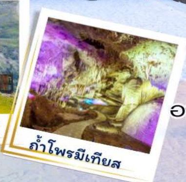
ถ้ำโพรมีเทียส