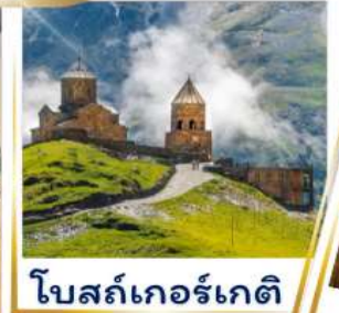
โบสถ์เกอร์เกติ