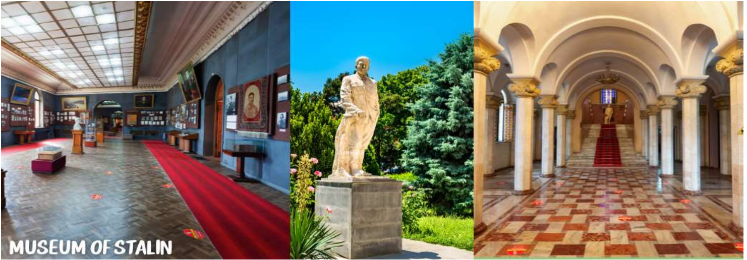
MUSEUM OF STALIN

นำท่านออกเดินทางสู่เมือง KUTAISI เป็นเมืองเล็ก ๆ ที่อยู่ระหว่างเมืองท่องเที่ยว UPLOSTSIKHE หรือ GORI และเมือง MESTIA (ใช้เวลาเดินทางประมาณ 2.30 ชม.)