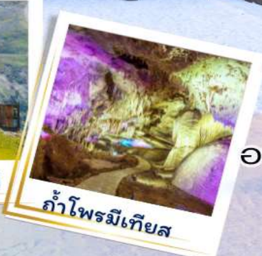
ถ้ำโพรมีเทียส