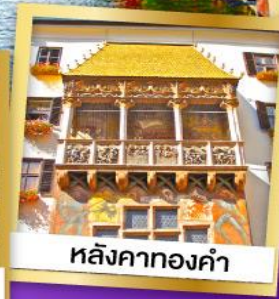
หลังคาทองคำ