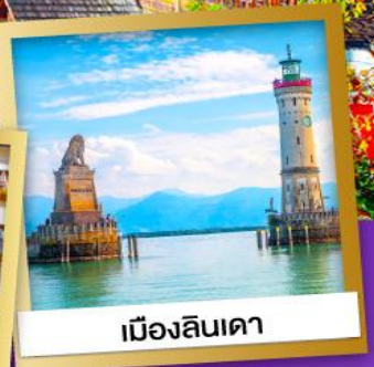
เมืองลินเดา