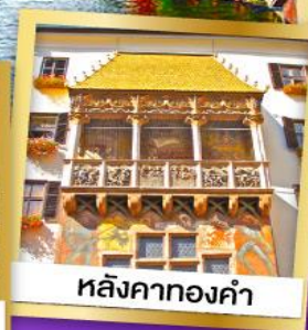
หลังคาทองคำ