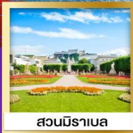
สวนมิราเบล